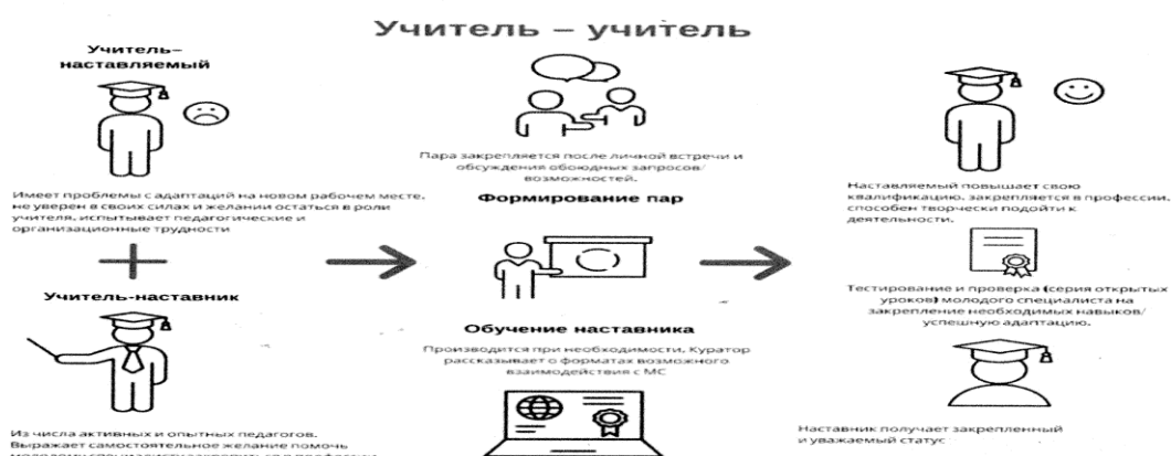
Рис. 2. Графическое представление реализации программы наставничества по форме «учитель – учитель».